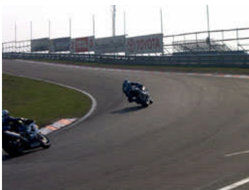
Foto 6, op kop na drie bochten in de eerste ronde.

De volgende rechts links combinatie steek ik de motor voorbij de nummers 1 en 2 en na drie bochten in de eerste ronde lig ik op kop.