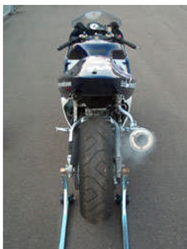
Foto 2, De Suzuki staat warm te draaien voor de eerste vrije training.